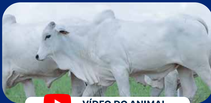
VÍDEO DO ANIMAL